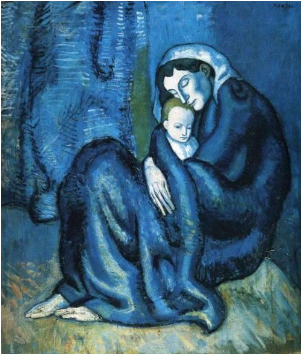
Picasso, Madre e hijo , 1901