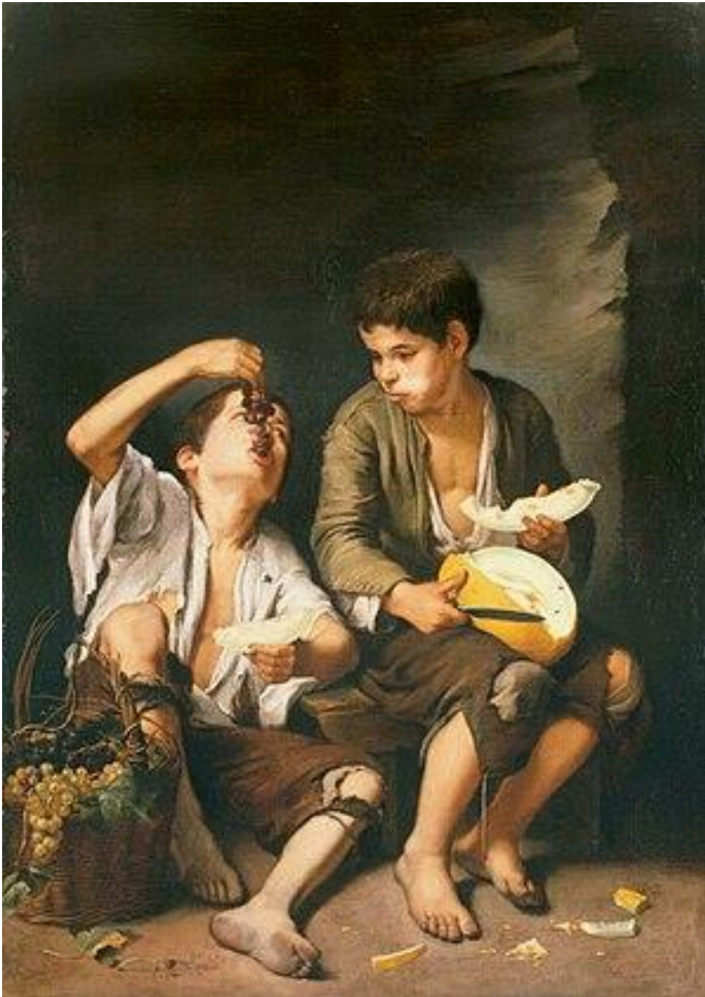
Murillo, Niños comiendo uvas y melón , 1645