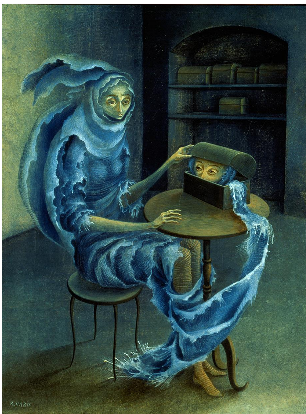
Remedios Varo, Encuentro , 1959