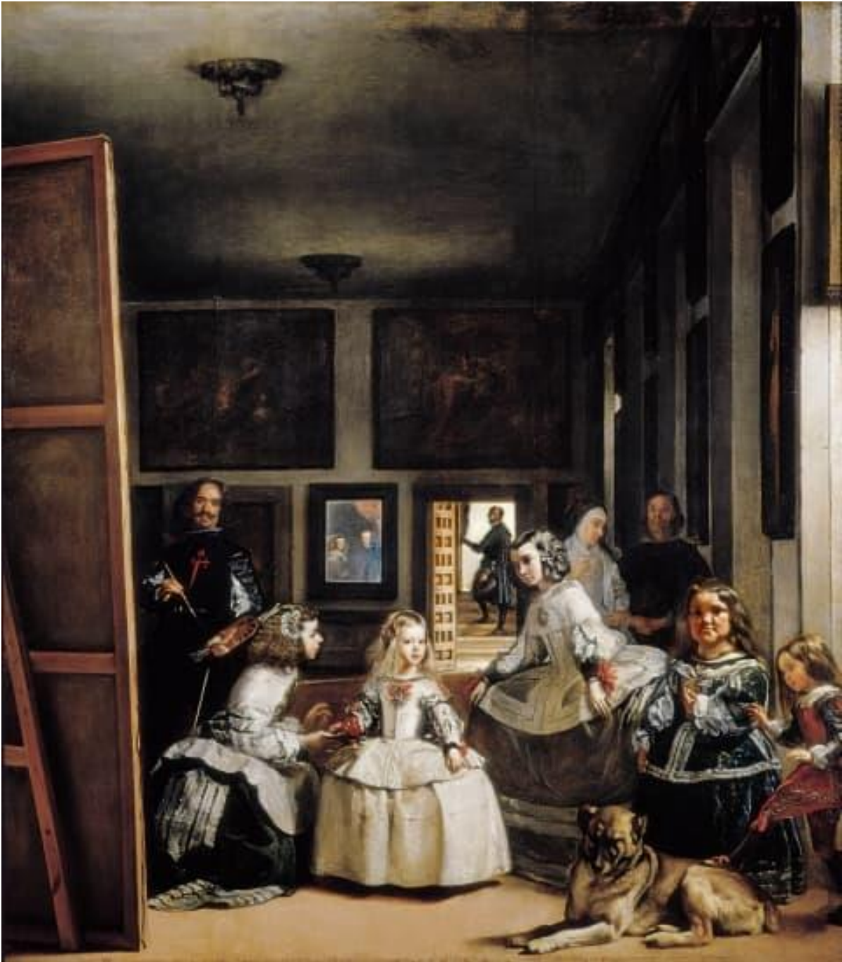
Diego Velázquez, Las meninas ( La familia de Felipe IV ), 1656