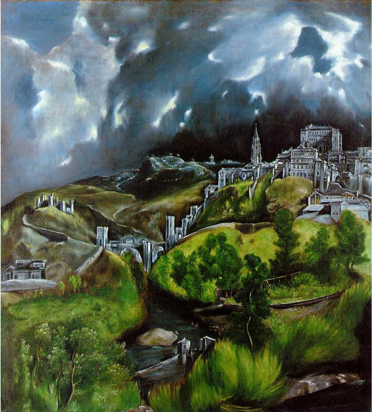
El Greco, Vista de Toledo , 1597-1600